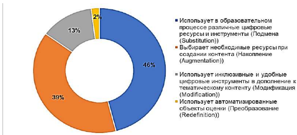
Рис. 2. Уровень готовности профессорско-преподавательского состава к применению интегрированных систем управления

В ходе интервьюирования представителей администрации университета, опроса профессорско-преподавательского состава были получены следующие результаты (рис. 2).