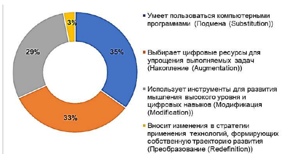
Рис. 3. Уровень готовности обучающихся к использованию интегрированных систем управления

Данные показатели демонстрируют, что профессорско-преподавательский состав по направлению применения технологических систем управления смешанным обучением находится на уровне накопления (Augmentation)